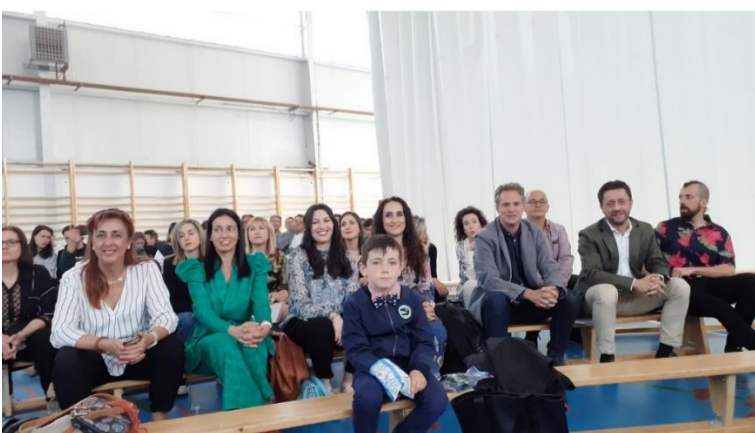
Los profesores se aposentaron en los bancos de gimnasia. Un poco encogidos, pero muy orgullosos.