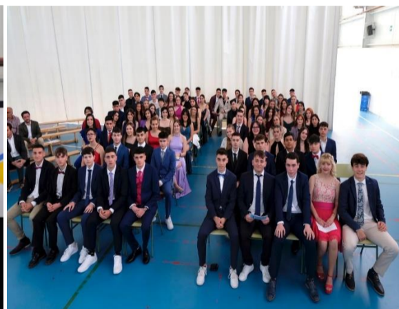
Vistas generales desde el escenario: graduados y familiares.