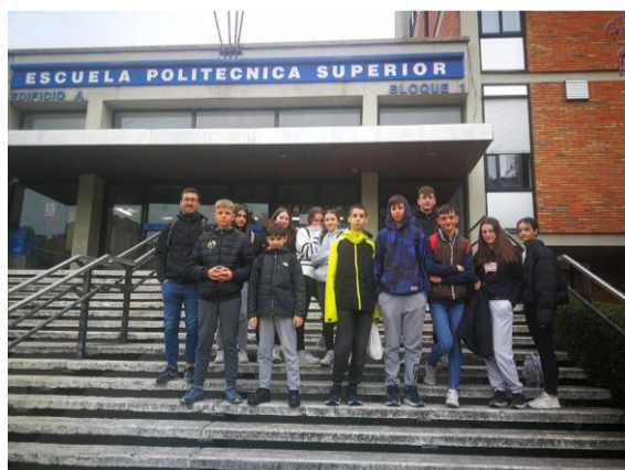
Día de la prueba

En esta excursión hemos aprendido un poco más de inglés, su cultura y hemos pasado un buen rato.