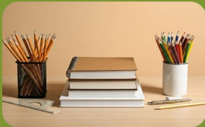
Materiales Permitidos por asignatura