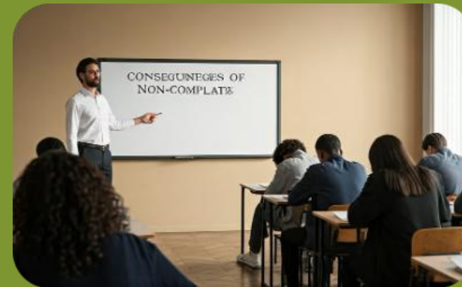
Consecuencias de incumplimiento