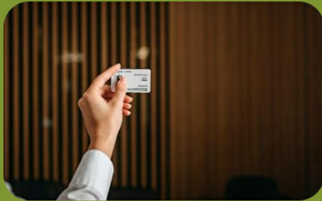
Documentación e identificación