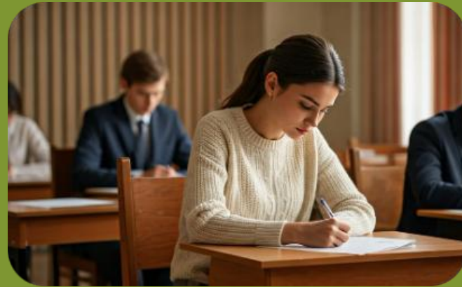
Normas de comportamiento