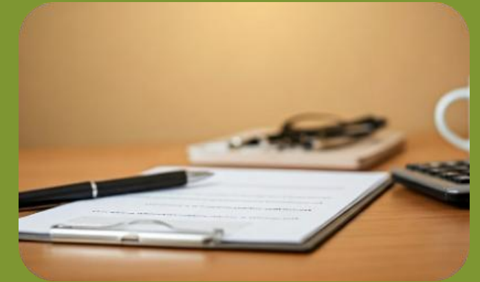
Material de examen