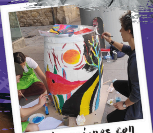
Colaboraciones con asociaciones