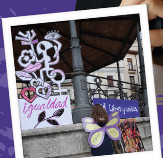
Proyectos para el 25N y el 8M