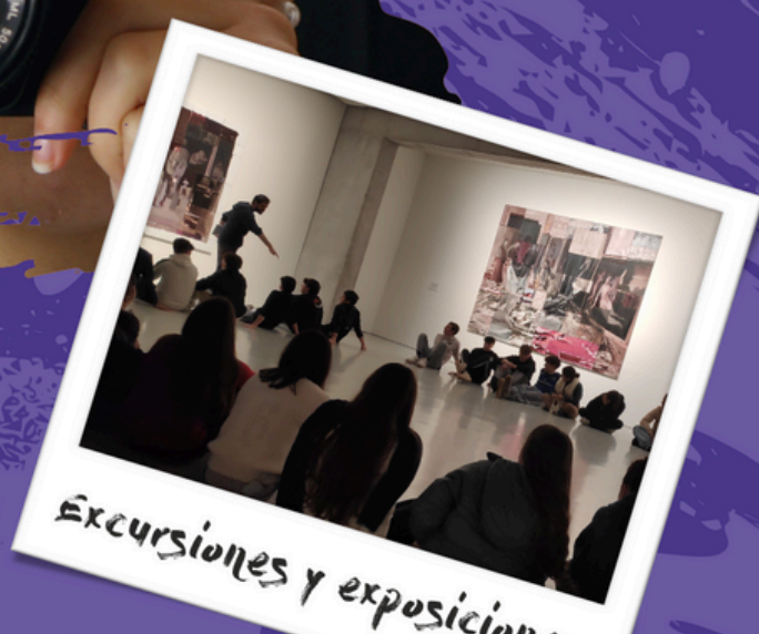
Excursiones y exposiciones